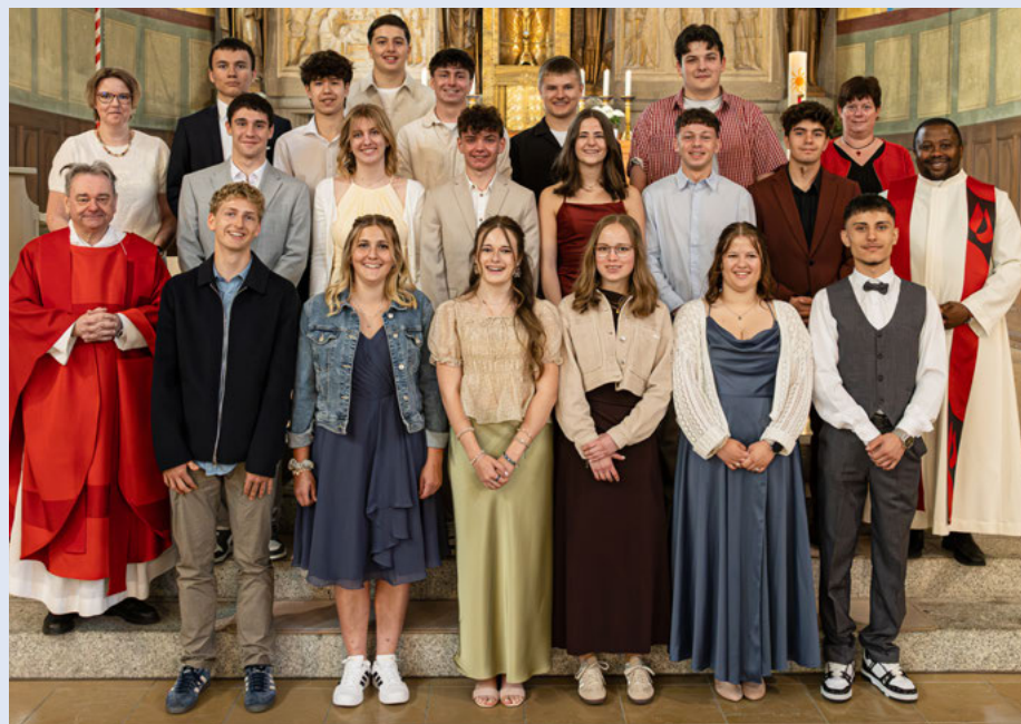
Die diesjährigen Firmandinnen und Firmanden von Flüelen und Sisikon.